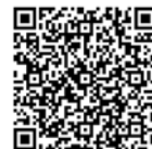
Código QR para inscripción talleres C. Igualdad en FAMILIA