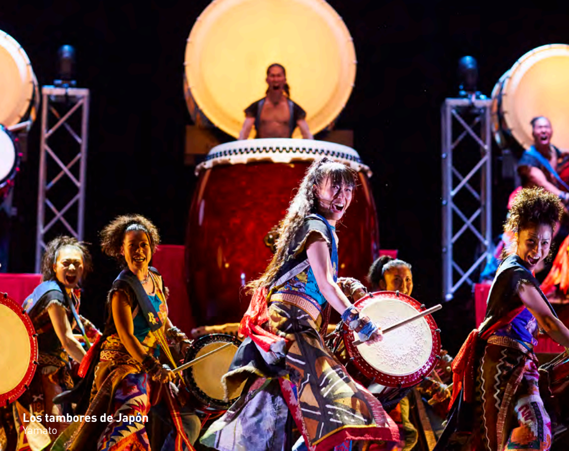
Los tambores de Japón Yamato

C/ Londres, 3 - Tel.: 91 674 98 70 - www.teatrojmrodero.es